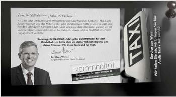
last call Election