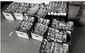
election 2022_breakfast for voters