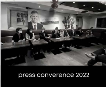
press conference 2022