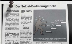
election 2004_atacc campaign