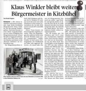
victory again 4.th time