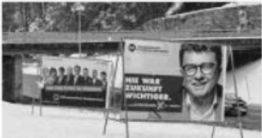
Bei der Gemeinderatswahl am 27. Februar wollen die Liste UK und die FPÖ in Kitzbühel koppeln.

Ich wünsche dem unermüdlichen Bürgermeister viel Glück für die nächsten sechs Jahre.