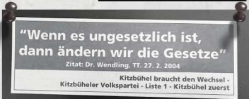
election 2004_atacc camp